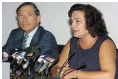
Η υπουργός Παιδείας και ο γ.γ. του υπουργείου της ανακοινώνουν τον Αύγουστο του 2005 την εφαρμογή του νέου μέτρου για την καθιέρωση του «10».

Το σκηνικό ολοκληρώθηκε με τηλεοπτικές εκπομπές που έδωσαν ακόμα πιο δραματική εικόνα για την κατάσταση της ελληνικής παιδείας και το «σκάνδαλο των βάσεων».